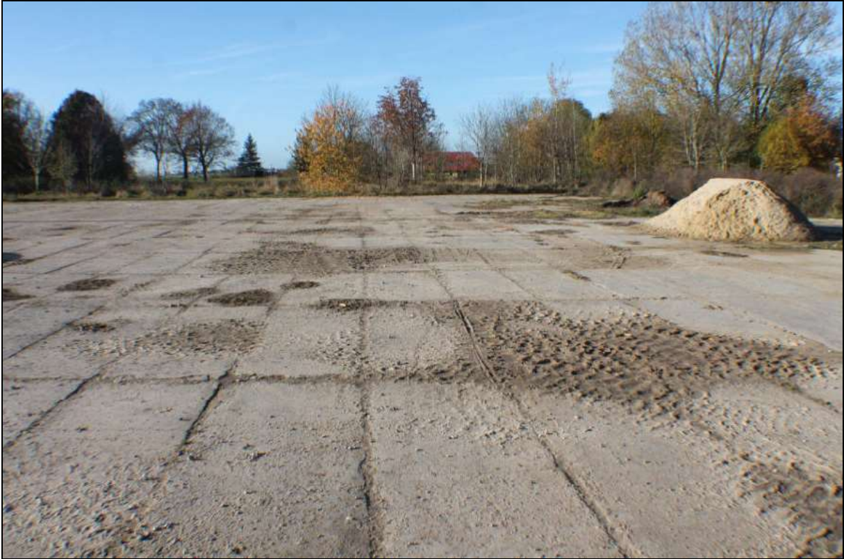
Abbildung 1: Blick auf den Norden des Planungsraumes (Blickrichtung Westen)

Maßgeblich für die Betrachtungen der Umweltauswirkungen des Vorhabens sind die unvermeidbaren Eingriffe in Natur und Landschaft durch geplante die Flächeninanspruchnahme betreffend die Schutzgüter Fläche, Boden, Tiere und Pflanzen. Die Lärm-, Staub- sowie Schadstoffimmissionen während der Bauphase sind bezüglich der Schutzgüter Mensch und seine Gesundheit sowie die Bevölkerung, Boden, Pflanzen und Tiere zu beurteilen. Außerdem ist die Wahrnehmbarkeit der Anlage bezüglich der Schutzgüter Tiere, Mensch und Landschaftsbild zu beurteilen.