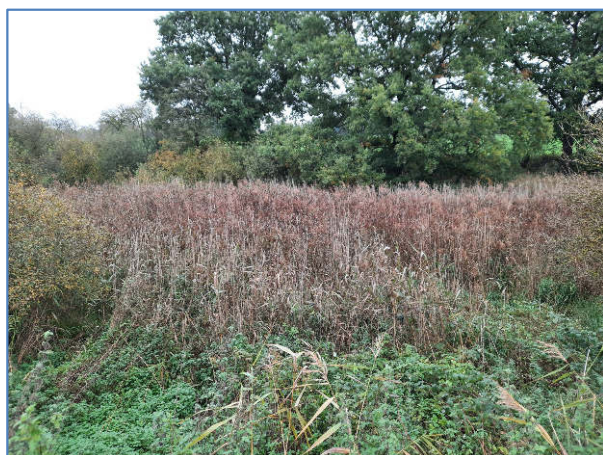
Abb. 2 bis 4 Ansichten des Kleingewässers