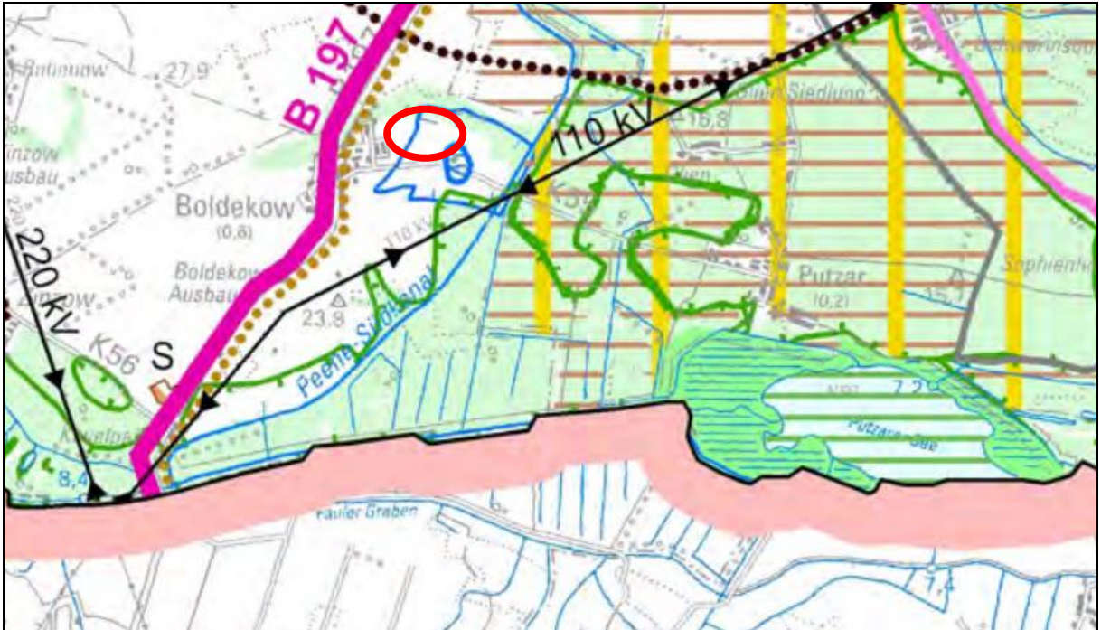
Abbildung 2: Ausschnitt aus dem RREP MS (Planungsraum rot markiert)

Aufgrund der Lage innerhalb eines Vorbehaltsgebietes für die Landwirtschaft ist eine Prüfung des Einzelfalls für die Belange der Landwirtschaft erforderlich.