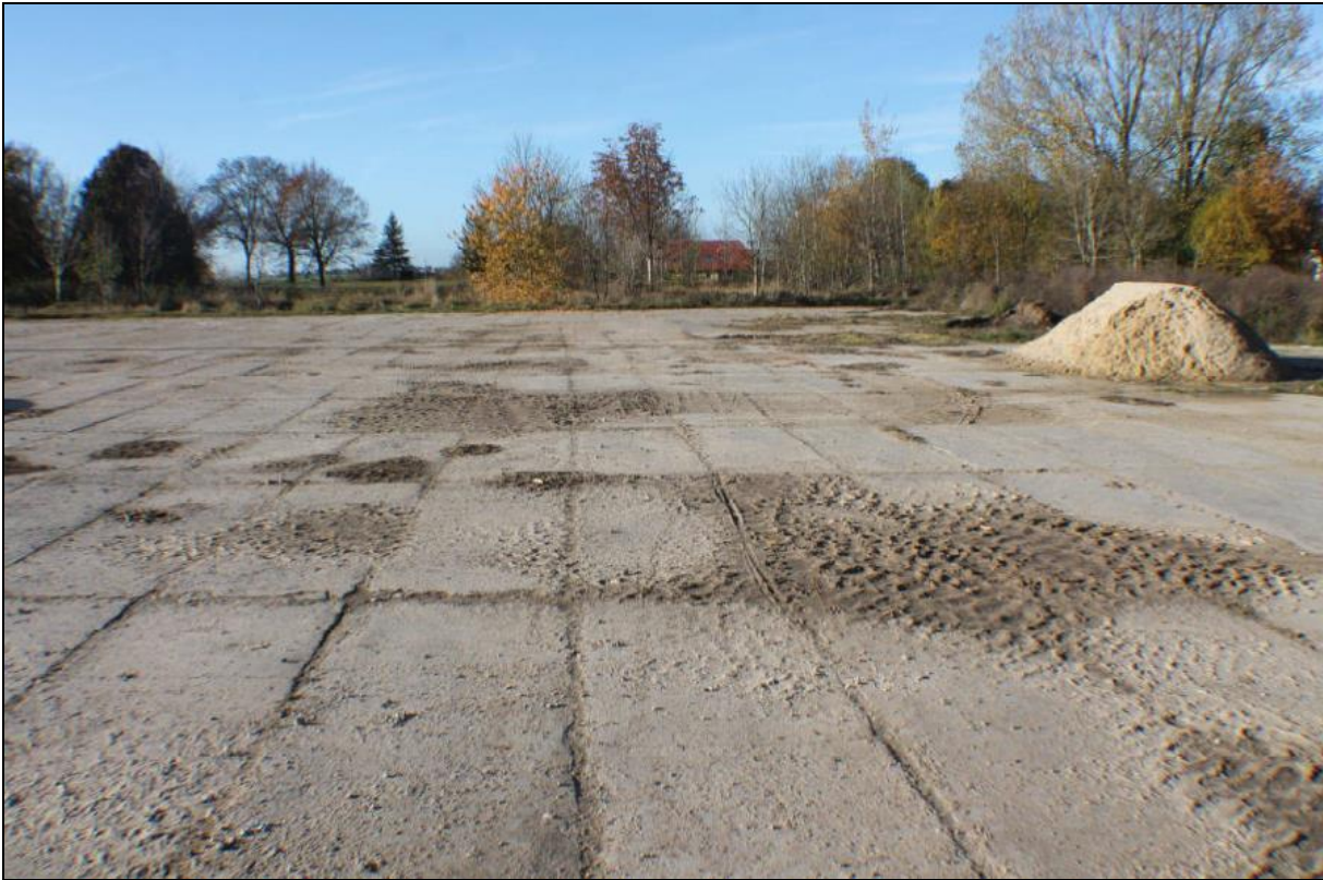
Abbildung 1: Blick auf den Norden des Planungsraumes (Blickrichtung Westen)

Maßgeblich für die Betrachtungen der Umweltauswirkungen des Vorhabens sind die unvermeidbaren Eingriffe in Natur und Landschaft durch geplante die Flächeninanspruchnahme betreffend die Schutzgüter Fläche, Boden, Tiere und Pflanzen. Die Lärm-, Staub- sowie Schadstoffimmissionen während der Bauphase sind bezüglich der Schutzgüter Mensch und seine Gesundheit sowie die Bevölkerung, Boden, Pflanzen und Tiere zu beurteilen. Außerdem ist die Wahrnehmbarkeit der Anlage bezüglich der Schutzgüter Tiere, Mensch und Landschaftsbild zu beurteilen.