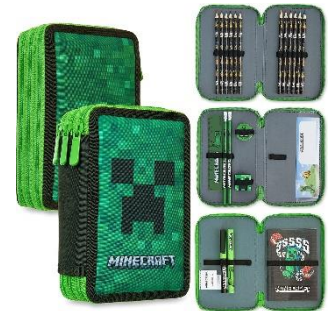
FEDERTASCHE / PENCIL CASE