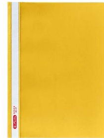
SCHNELLHEFTER / FOLDER (2x !!!)