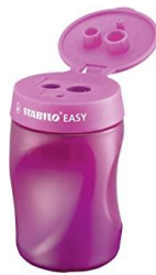
ANSPITZER / SHARPENER