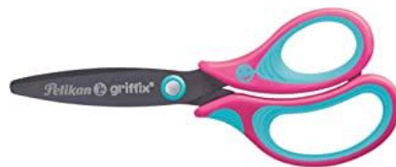
SCHERE / SCISSORS