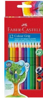
BUNTSTIFTE COLORED PENCILS