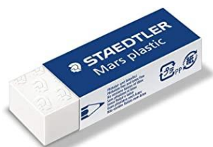
RADIERGUMMI / ERASER