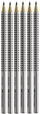
BLEISTIFTE / PENCIL