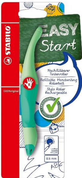
TINTENROLLER / ROLLERBALL