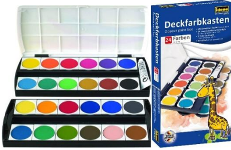
MALKASTEN / PAINTBOX

Alles 1x kaufen pro Kind und mitbringen.