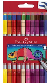
FILZSTIFTE FELT PENS