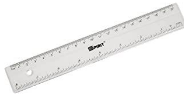
LINEAL / RULER